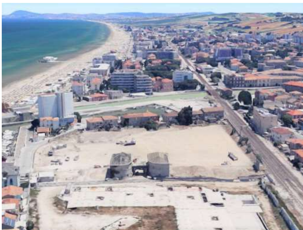
Źródło własne - Biomass Energy Project S.A Teren realizacji inwestycji Senigallia Włochy