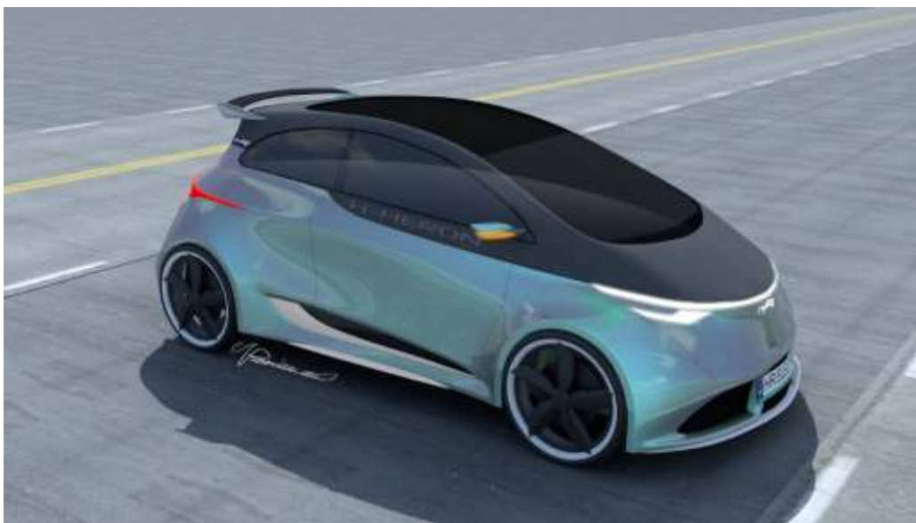
Projekt samochodu osobowego z napędem elektrycznym dla Heron Electric S.