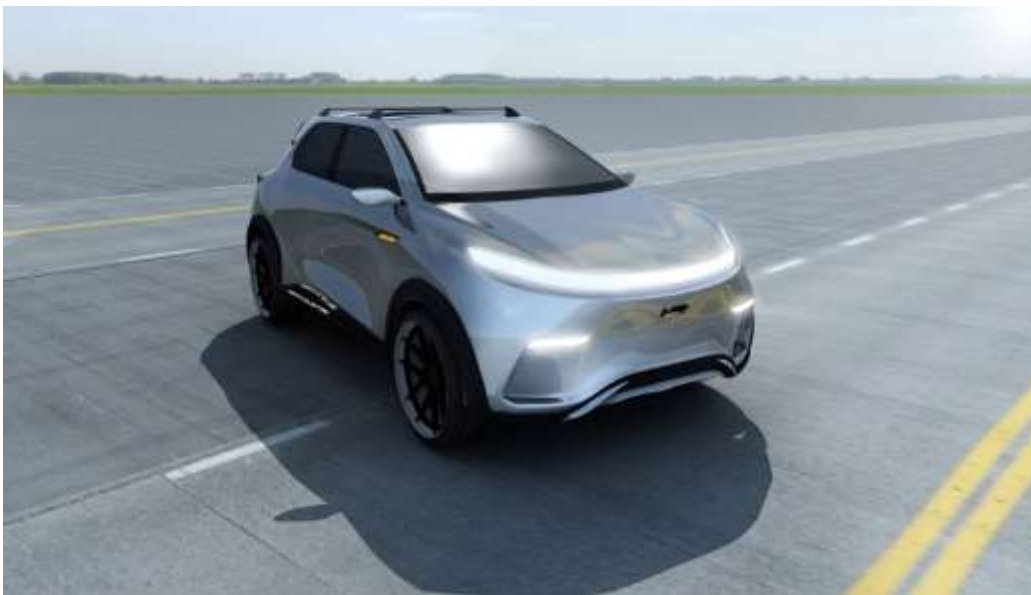
Źródło własne - Biomass Energy Project S.A. . Projekt SUV-a z napędem elektrycznym