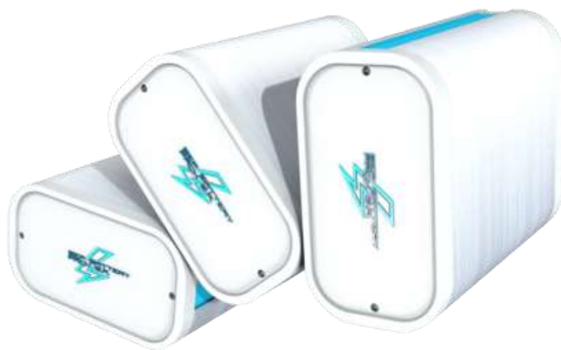
Systemy baterii litowych